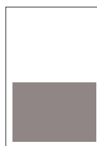
1/2 page largeur FU l 168 x 110 h