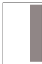
1/3 page hauteur FU l 53 x 225 h